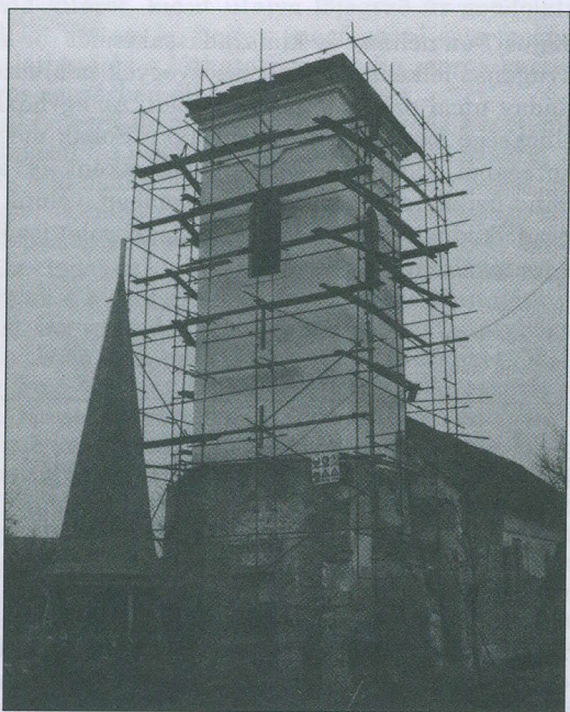
A megújuló hercegyszőlősi templom, 2004 február

Nem az. Nem új honfoglalás az, hogy a magyarság nagyobb része belépett az Európai Unióba, amely – sajnos, bizonyos mai nagyhangú „européerek” miatt – nem történhetett több évtizeddel korábban! Sok minden változik, bár ugyanakkor sok minden marad változatlan. Az Európai Unió nem csoda, nem „álmok beteljesítője”, hanem egy itt és most nyíló esély, lehetőségeket is nyújtó helyzet. Azzal együtt, hogy vesztesek is lesznek, akiknek éppen ezért jövőjét viszont már erőteljesen meghatározza a mostani kormánypolitika minősége.