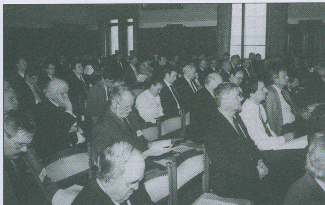
A közgyűlés résztvevői

Határozat: A fenti határidőket az Egyházkerületi Közgyűlés megerősíti és azok pontos betartását kéri.