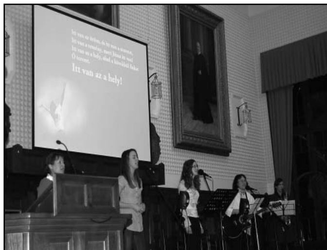
A Keresztút együttes koncertje a budapesti találkozón