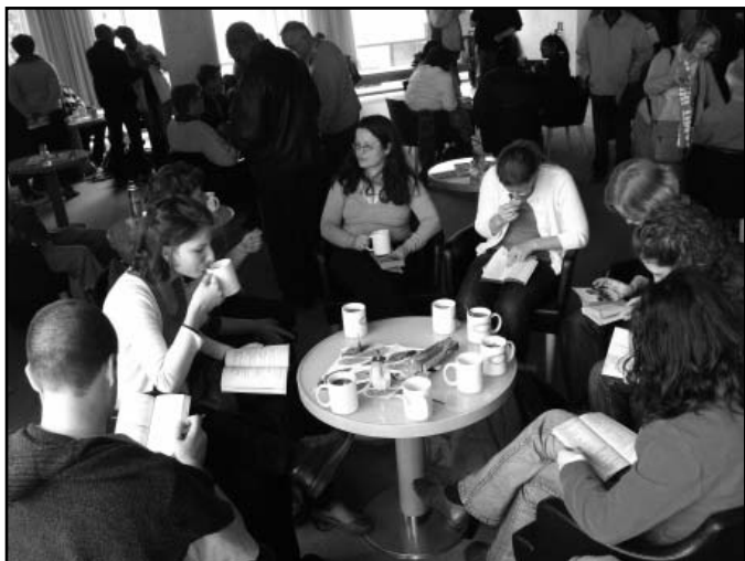
Teológusok válogatnak a Kirchentag programjai közül Münchenben