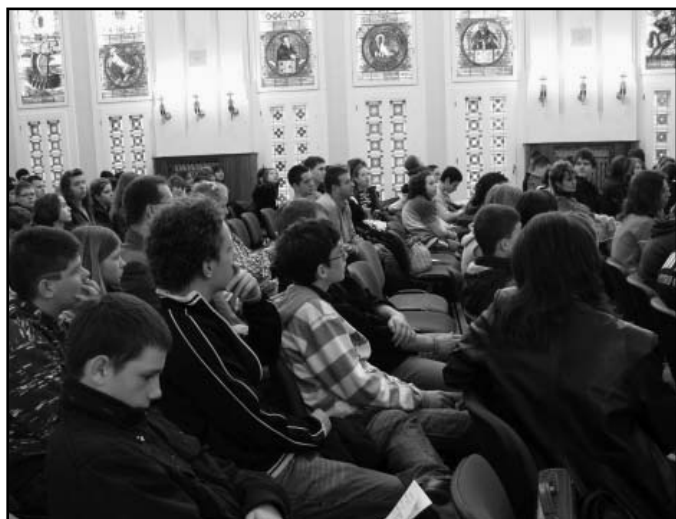
Ifjúsági konferencián Kecskeméten