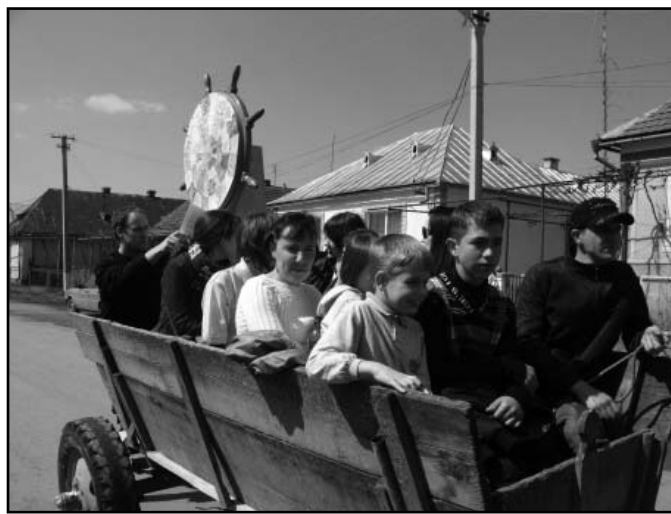
Isten a szekéren-program Salánkon

Ezen a nyáron is szerveznek több építőtábort, az egyiket a felvidéki Berzétén, ahol egy visszkapott is-